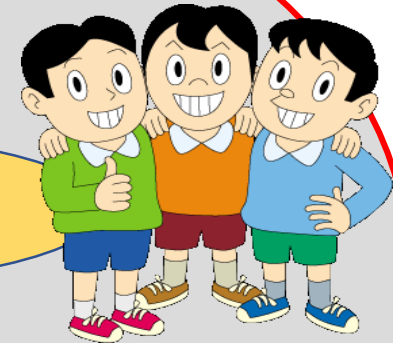
支持的風土の醸成